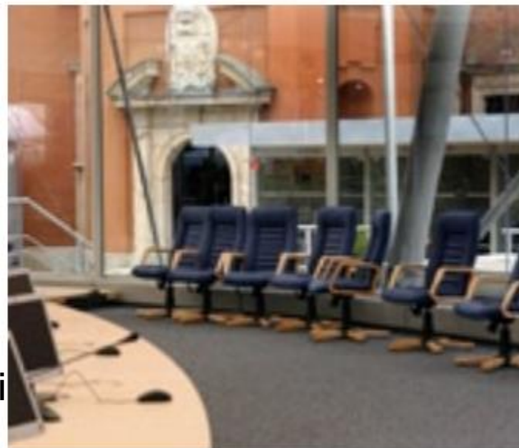
> Szczyt Rady Europy, Polska. Krzesła marki Nowy Styl.

Wysłuchując się w oczekiwania kilkudziesięciu milionów użytkowników swoich wyrobów na całym świecie, firma nie zapomina o odpowiedzialności za otoczenie, w którym działa. Dlatego niemal od początku swego istnienia prowadzi szeroką i różnorodną działalność społeczną, przywiązuje dużą wagę do troski o środowisko naturalne